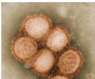
Εικόνα 1. Ο ιός γρίπης τύπου Α(H1N1).