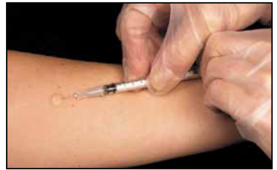
Εικόνα 2: Η φυματίνη ενίεται αυστηρά ενδοδερμικά. Αμέσως μετά δημιουργείται πομφός διαμέτρου 6-10 mm παραμένει για 10 λεπτά περίπου.

Ωστόσο, αυτό το πρώτο τεστ μπορεί να διεγείρει το ανοσιακό σύστημα, προκαλώντας μια θετική, ή ενισχυμένη (boosted), απάντηση σε ακόλουθα τεστ μέσω ανάκλησης ανοσίας. Βέβαια η ενισχυμένη απάντηση είναι λιγότερο ειδική για τη διάγνωση της ΛΦ από ότι το αποτέλεσμα του αρχικού τεστ, δεδομένου ότι ενισχυμένη απάντηση μπορεί να προκληθεί από προηγούμενο εμβολιασμό BCG, ευαισθητοποίηση σε μη φυματιώδη μυκοβακτήρια ή απομακρυσμένη (remote) λοίμωξη. Συνεπώς, ο κίνδυνος ενεργού φυματίωσης μεταξύ των ατόμων με μια ενισχυμένη απάντηση (θετικό αποτέλεσμα σε ένα τεστ που