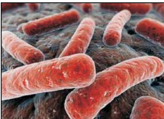
Εικόνα 1: Το M. tuberculosis είναι ένα αερόβιο βακτηρίδιο με ασυνήθιστη κυτταρική επιφάνεια αποτελούμενη από λιπίδια και μυκολικά οξέα. Δεν χρωματίζεται κατά Gram λόγω της κηρώδους επιφάνειάς του, αλλά ταξινομείται στα Gram θετικά βακτήρια επειδή δεν κατέχει εξωτερική μεμβράνη.