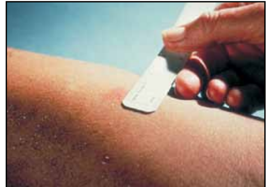
Εικόνα 3: Ανάγνωση της φυματινοαντίδρασης Mantoux. Η εγκάρσια διάμετρος της διήθησης (σκληρίας) μετράται προσεκτικά σε χιλιοστά και αξιολογείται. Διάμετρος σκληρίας: 0-5 mm = Αρνητική, 6-14 mm = Θετική, >15 mm = Έντονα θετική.

χορηγείται 1 με 4 εβδομάδες μετά από ένα αρχικό αρνητικό αποτέλεσμα επί απουσίας έκθεσης) είναι χαμηλότερος από τον αντίστοιχο μεταξύ των ατόμων με μια αρχική θετική απάντηση στη ΦΑΜ 12 .